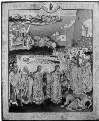
Бари и святитель Николай

Перенесем в небольшой город Бари на юге Италии. Нас встречают живописные старинные улицы, на которых выставлены кадки с живыми цветами. Толстые каменные стены массивных домов сохраняют внутри живительную прохладу. Двери открыты настежь, в проемах колышутся белоснежные занавески. Тишина, спокойствие и благодать. От мостовых и стен домов чувствуется дыхание истории старинного портового города, появившегося еще в III веке до Рождества Христова.