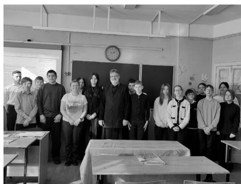
Встреча со священником: Обсуждение Великого поста с семиклассниками.