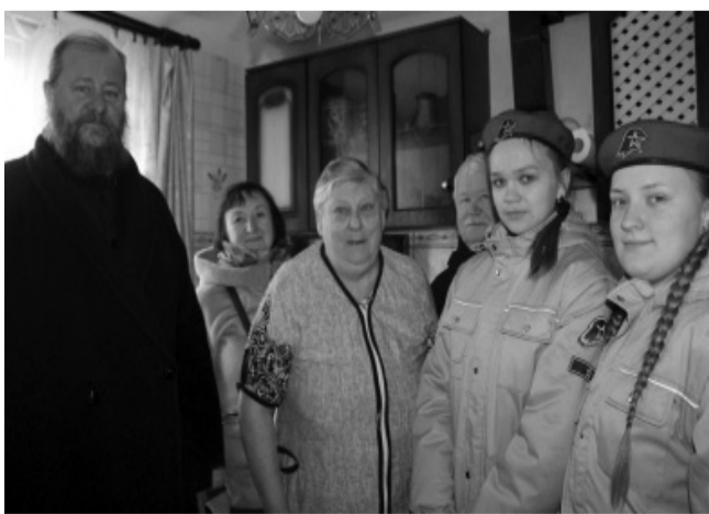
Церковная служба социальной помощи и благотворительности Нелидовского благочиния Ржевской епархии.