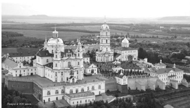
Свято-Успенская Почаевская лавра

В Почаев же всегда рвешься за каким-то духовным ответом. Ты или от людей хочешь его услышать, или от святых – место это такое. А на Светлой седмице ехали туда порадоваться и поторжествовать с нашими любимыми святыми.