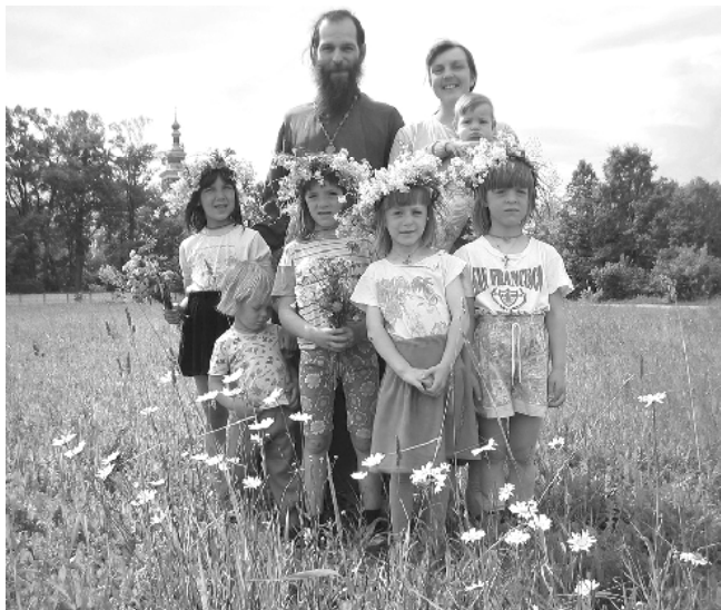
В своей семье уже не хозяин

Как-то натолкнулась в интернете на подборку рассказов иностранцев об их впечатлениях о России. Среди них была история одного парня из Швеции, которому довелось пожить в российской семье. И на него это произвело неизгладимое впечатление. Он сделал для себя открытие, что в России семья еще осталась как таковая!