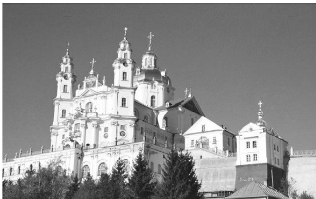
Свято-Успенская Почаевская лавра

После этого проходит год и я покупаю частный дом с землей. И я так понимаю, что отец Амфилохий помог мне получить то, что для меня лучше. Считаю, что этот дом у меня появился благодаря заступничеству этого святого. Потому что я просила что-то сделать с моей спиной, и он сделал. Он дал мне место, где я могу трудиться физически – тут я делала ремонт, сажала сад, окучивала грядки. Вот такое у меня воспоминание о преподобном.