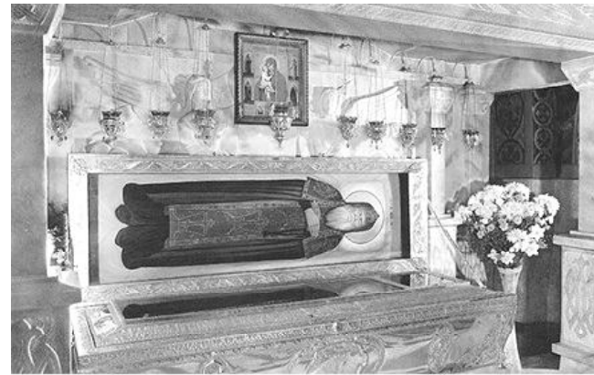
Рака с мощами преподобного Амфилохия Почаевского

Чудесный батюшка – смотришь на его икону, и душа наполняется радостью. И когда приезжаешь в Почаев и подходишь к раке – это чувствуешь нутром, где-то там в глубине. У меня к нему любовь и привязанность. Еду в Почаев в пятый раз и всегда – к батюшке Амфилохию. Мне даже иногда бывает стыдно перед самой собой: всё-таки преподобный Иов – первый настоятель Лавры, и к нему едешь. Но батюшка Амфилохий почему-то теплее как-то.