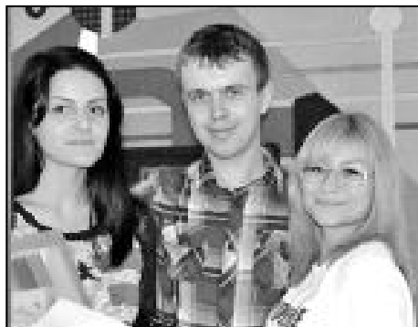
(окончание. Начало на стр. 5)

На форуме можно было увидеть около сотни разнообразных молодежных газет, познакомиться с теле- и радиопродукцией, посетить фотовыставку. Кстати, мною на выставку были представлены странички «Божий мир», сюжеты и фотографии «Дай 5», высоко оцененные делегатами. Кроме того, на форуме состоялась рабочая встреча с редакторской коллегией ведущих молодежных изданий Волгограда, Рязани, Воронежа, Москвы, Курска и Белгорода.