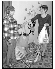
одно из основных мероприятий данного социального проекта прихода.

социальной защиты населения осуществляется на арендуемом приходе для этого автотранспорте. Обеспечивать работу по проведению всех этапов данной благотворительной акции организованно и оперативно приходу церкви Балькинской иконы Божией Матери помогает прежде всего наш новый грантовый социальный проект «Церковно-общественный ресурсный центр (ЦОРЦ) «Содействие» – как ОБЕРЕГ и БЛАГОСФЕРА для Семьи, детей, бедных и немощных» – победитель Международного конкурса «Православная инициатива». А благотворительная акция «Семья-семье» – это тоже