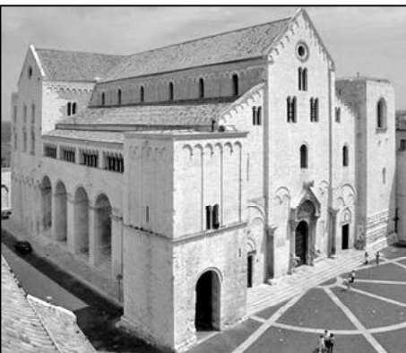
Базилика в г. Бари, где покоятся мощи свт. Николая