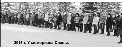
2013 г. У мемориала Славы.

25 января, 71 год назад, в Нелидово прозвучали последние выстрелы фашистского оружия. ТАСС сообщало: «В течение 25 января наши войска вели упорные бои с противником. Наши части вновь продвинулись вперёд, заняли несколько населённых пунктов, в их числе посёлок Нелидово на железной дороге Ржев-Великие Луки».