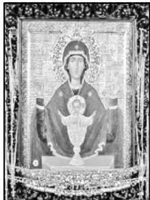
Место для Высоцкого Богородицкого мужского монастыря избрал Сер-

16 февраля 2013 года организуется паломническая поездка в Серпухов (Московская обл.) к чудотворной иконе Божьей Матери «Неупиваемая Чаша» в Высоцкий Богородицкий и Введенский монастыри.